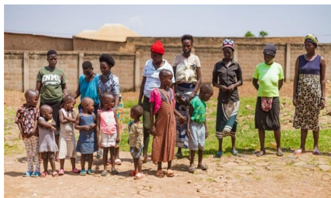
Groepje dakloze meisjes en hun kinderen Precious You Rwanda

In Rwanda hebben mensen een jaarlijkse medische verzekering. De verzekering begint met de maand juli. De medische verzekering is erg belangrijk, omdat iedereen zo toegang heeft tot medische zorg. Met een medische verzekering worden de ziektekosten voor 90% verzekerd. Dit is een zeer goede zaak.